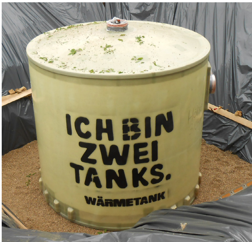
Der Haase-Wärmespeicher zur unterirdischen Lagerung thermischer Energie Im unteren Bereich sind die Schubknaggen für die Auftriebssicherung zu sehen, die bei hohem Grundwasserstand empfohlen werden.

Der Speicher besteht aus einem Stahl-Druckbehälter, der umlaufend mit 100 mm starkem Polyurethanschaum isoliert ist. Diese Dämmung wird durch eine Hülle aus glasfaserverstärktem Kunststoff (GFK) gegen anstehendes Regen- oder Grundwasser geschützt.